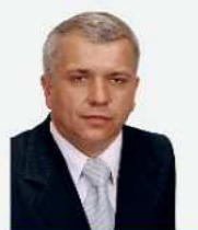
ANDRZEJ SZYMANOWSKI 1